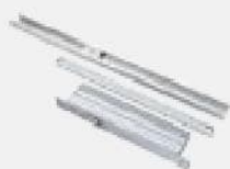
Доводчик Hafele DCL 32