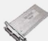
Доводчик торцевой Hafele EN3