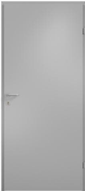
Модель 23.05/Исполн.63 30 минут