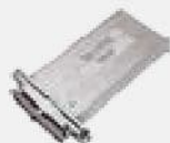
Доводчик торцевой Hafele EN3