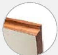
Торец из натурального дерева