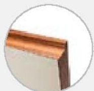
Торец из натурального дерева