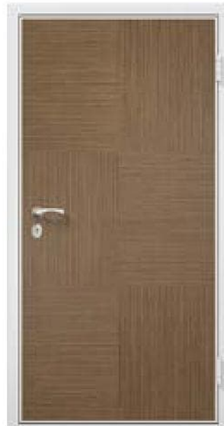
Модель 23.52 60 минут