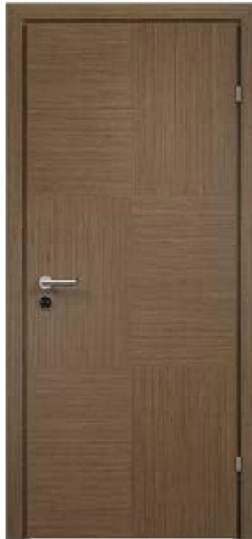
Модель 39.78 Доп.функц. - электромеханический замок