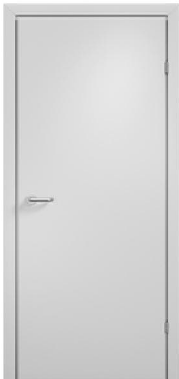
Модель 10.04/Исполнение 00