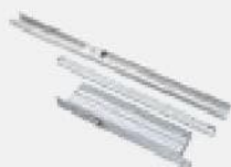
Доводчик Hafele DCL 32