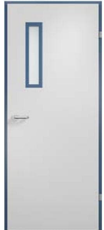
Модель 39.15 Рамка металл; Коробка металл