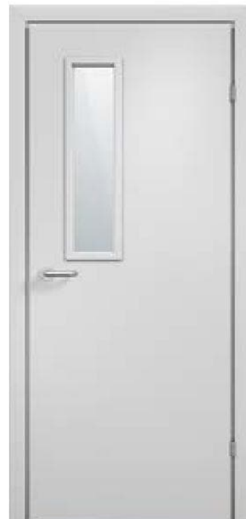
Модель 10.04/Исполнение 01