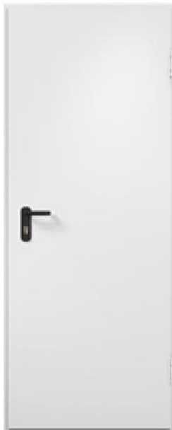
Модель 23.01 - 90 минут 23.02- 60 мин./23.05- 30 мин.