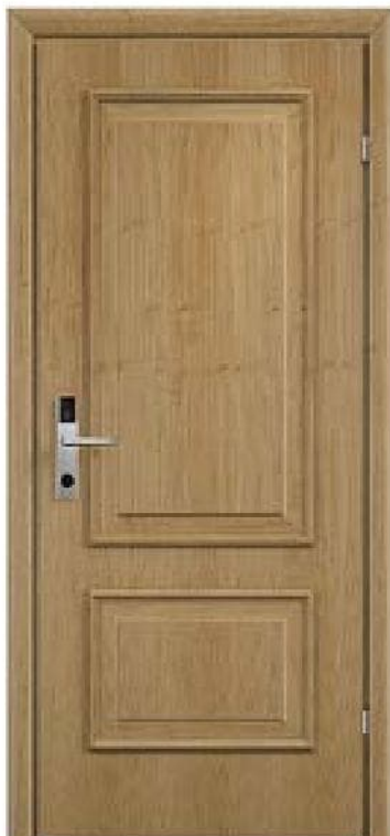
Модель 10.04/Исполнение 53 Доп. функц. - электромеханический замок