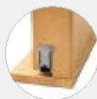
Выдвижной порог (открыт/закрыт)