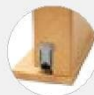
Выдвижной порог (открыт/закрыт)